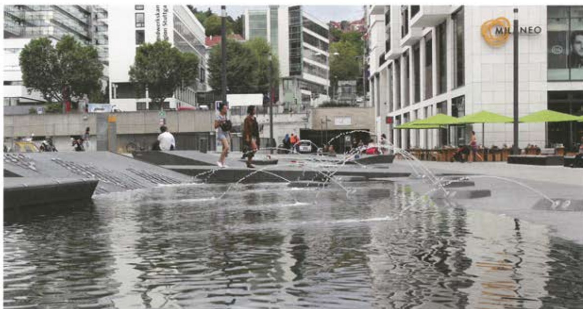
Das Wasserspiel zeigt sich mit unterschiedlichen Dynamiken, mal mit flachen Quellpunkten, mal mit kleinen Fontänen.

über Schlitzrinnen und Bodenabläufe ebenfalls in den Regenwasserkanal. Im Falle von Starkregenereignissen bis zu einer 30-jährigen Wiederkehrhäufigkeit, die den Bemessungsregen ( T_n=2a ) der Schlitzrinnen und Bodenabläufe übersteigen, kann der Mailänder Platz flächig eingestaut werden. Die Hauptneigung und damit auch Fließrichtung des Geländes ist von Nordwesten nach Südosten ausgerichtet, mit Ablauf zur Londoner Straße. Das Einzugsgebiet umfasst eine Gesamtfläche von ca. 10.000 Quadratmeter.