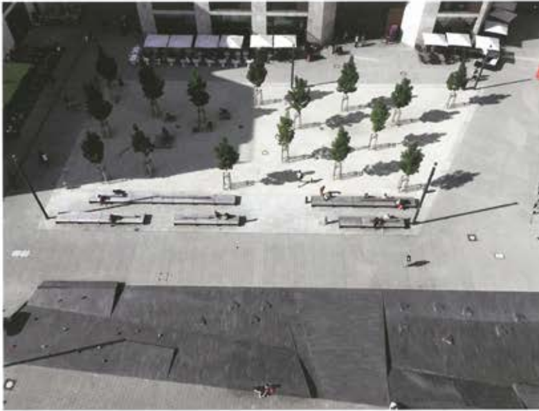
Von der Stadtbibliothek aus kann der Baumhain und ein Teil der Brunnenanlage überblickt werden.