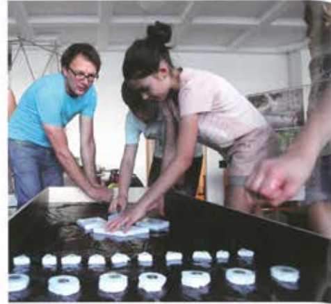
Mit Stuttgarter Schülern wurde im Vorfeld ein Workshop veranstaltet, in dem Wassertests für den Platz durchgeführt wurden.

Die an die Wasserachse angrenzenden Flächen des Platzes wurden in ähnlicher Farbe und Haptik und damit homogener Materialität ausgeführt. Die Schlichtheit der Materialwahl stärkt die Wertigkeit der Brunnenanlage aus Naturstein und greift die kühle Eleganz der Architektur der Bibliothek auf. Der Baumplatz daneben mit langer Bank zelebriert das Grün und die Natürlichkeit im steinernen Korsett - ein bewusst gestalteter, starker Kontrast.