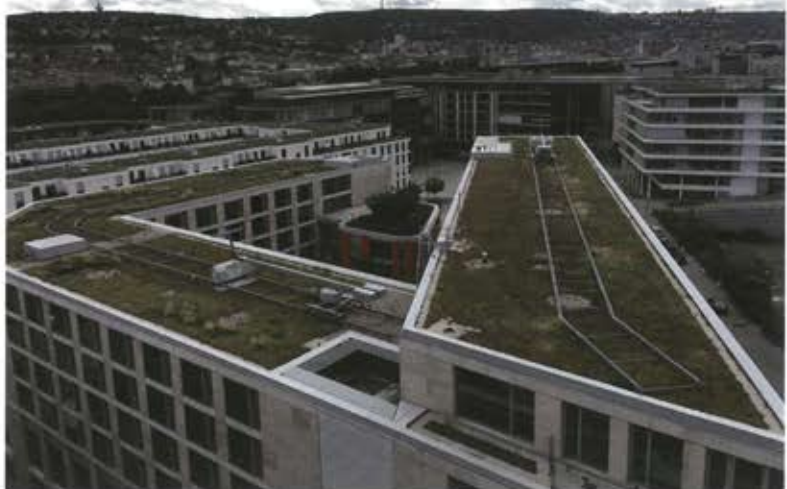
Auf den Gründächern der umliegenden Gebäude wird das Regenwasser gesammelt