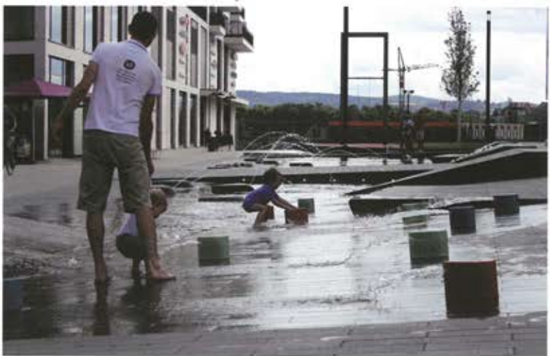
Der Aussichtskorridor der Londoner Straße sowie das Vorfeld der Bibliothek verlangen Offenheit. Das Basaltplateau bietet eine leere hochwertige Fläche, die auf unterschiedliche Art und Weise mit Wasserthemen bespielt wird.