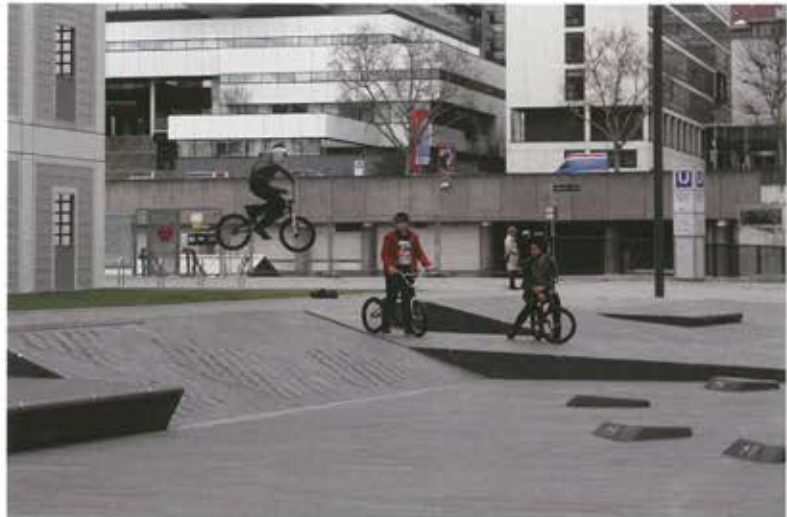
Der Platz bietet unterschiedlichste Nutzungsmöglichkeiten für Jung und Alt, Besucher und Kunden.

In einem kompakten Bauwerk unter dem Baumhain ist die komplette Technik für die Brunnenanlage mit Behältern, Pumpen, Filtern und Steuerungstechnik untergebracht. Auf Grund der engen Platzverhältnisse mit Tiefgaragen und S-Bahntunnel entstand eine dreistöckige Brunnenstube. In der unteren Ebene wird das Regenwasser in der Zisterne bevorratet. >>